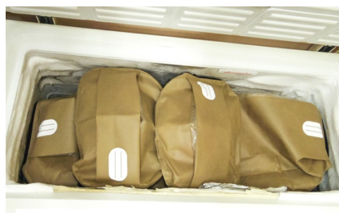
Une armoire frigorifique où reposent les animaux et que l'on peut enfin présenter aux familles