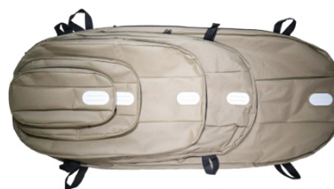
5 tailles permettant de gérer une large gamme de poids