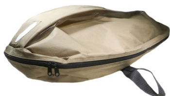
Des poignées pour porter les animaux lourds et une traçabilité garantie