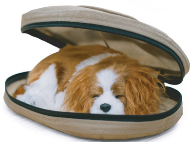
L'animal en position avant de fermer définitivement la housse